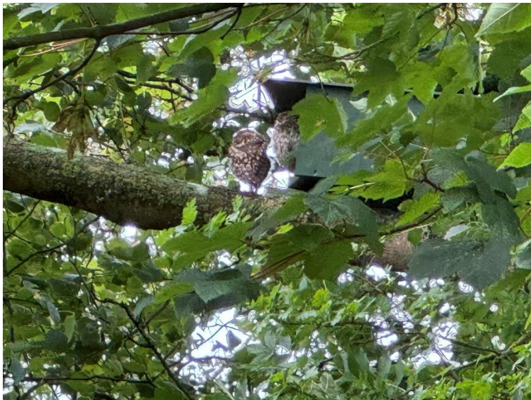
Ausgewilderte Jungvögel in Tetenbüll

Nach den Auswildern haben wir schon diverse Meldungen unserer Steinkäuze erhalten und an verschiedenen Standorten neue Nistkästen angebracht. Am häufigsten bekommen wir aus Tetenbüll Rückmeldungen über unsere jungen Steinkäuze und wir sind schon gespannt auf die nächste Brutsaison