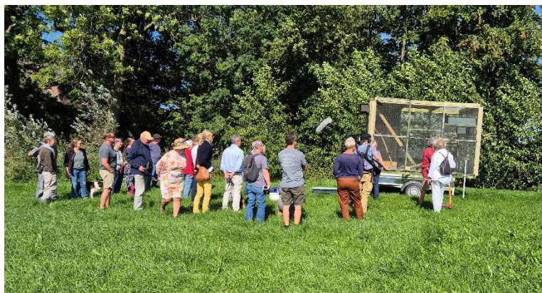
Auswilderung zusammen mit Fernsehteam des NDR

An einem der beiden Auswilderungstermine wurden wir auch von einem Fernsehteam begleitet und wir konnten bei bestem Wetter zusammen mit rund 25 Paten die Jungvögel in die Auswilderungsvolieren setzen.