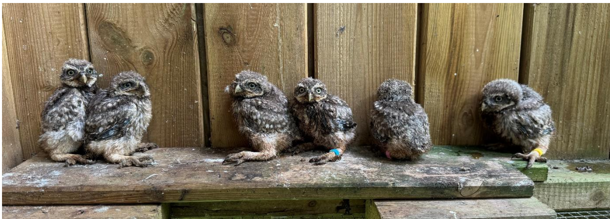
Steinkäuze Nestlinge aus Tetenbüll

Bei der Nachzucht können wir in 2024 auf eine sehr erfolgreiche Brutsaison zurückblicken. In unseren eigenen Volieren hatten wir in diesem Jahr zwei Brutten mit insgesamt 11 Jungvögeln. Darüber hinaus erfreuen wir uns nach wie vor der tollen Unterstützung einiger Falknereien und des Wildpark Mölln. So wurden uns insgesamt 19 Jungvögel für die Auswilderung und Nachzucht zur Verfügung gestellt.