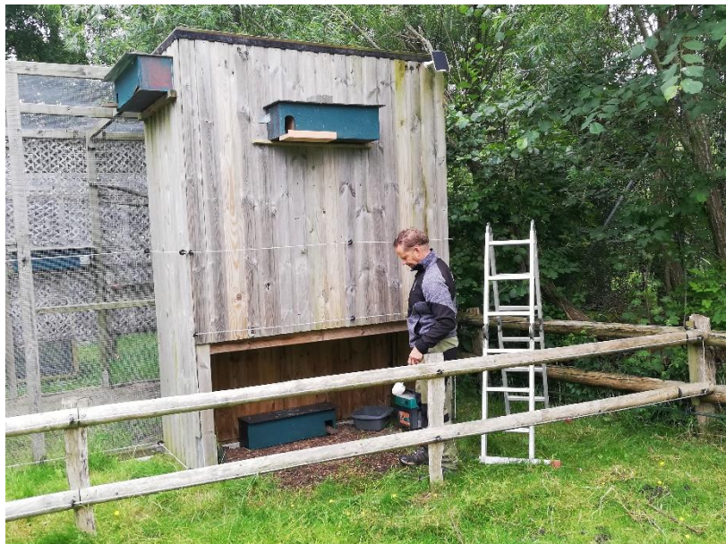
Sicherung der „Bodenbrut“

Beim Westküstenpark in St. Peter-Ording hatten wir einen Zufallsfund. In einem Verschlag unterhalb der Zuchtvoliere, unserem Materiallager, gab es quasi eine „Bodenbrut“. Aus Sicherheitsgründen haben wir den Nistkasten während der Brut zwei Meter höher gehängt. Die jungen Steinkäuze haben die Aktion gut überstanden und sind etwa drei Wochen später ausgeflogen.