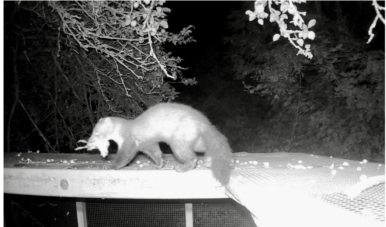
Nächtlicher Besuch auf der Auswilderungsvoliere

Zum Glück ist unseren Steinkäuzen nichts passiert!