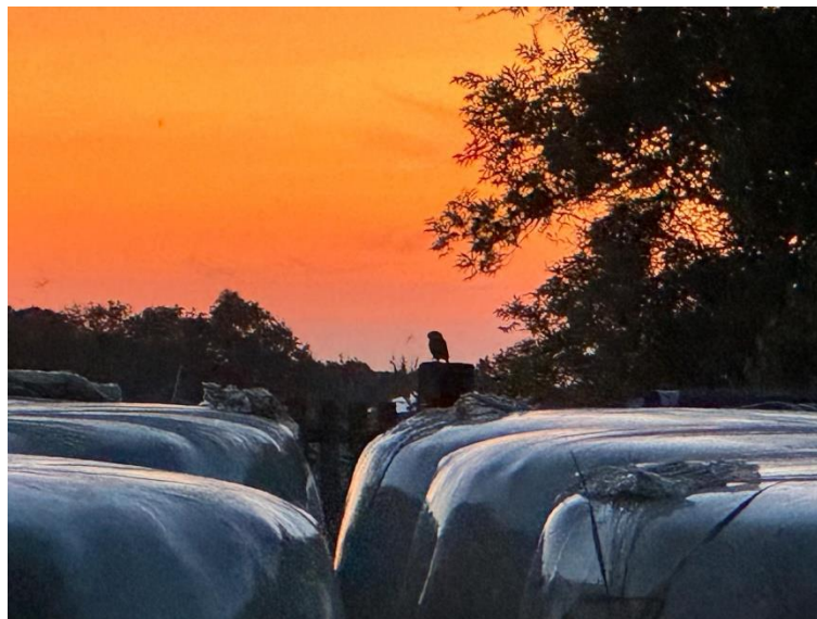
Ausblick in ein neues Leben

In 2025 werden wir zuallererst die vier Standorte erhalten und die Kleingruppen weiter zu unterstützen. Falls die Nachzucht außergewöhnlich groß ausfällt oder weitere Bruten im Freiland stattfinden, ist auch die Etablierung eines weiteren Auswilderungsstandortes denkbar.