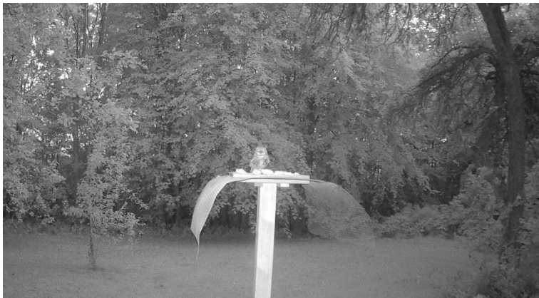
Besuch auf der mardersicheren Futterstelle

Im Spätsommer standen dann die „ganz normalen“ Auswilderungen auf dem Programm, bei der anders als bei der Familienauswilderung, die Jungvögel in Kleingruppen zusammengestellt werden. Immer so, dass nach Möglichkeit ein paritätisches Geschlechterverhältnis vorliegt und die Jungvögel von verschiedenen Zuchtpaaren stammen. Da wir in diesem Jahr aus vier Falknereien und einem Wildpark Jungvögel bekommen haben, ist für eine diverse Abstammung der Jungvögel gesorgt.